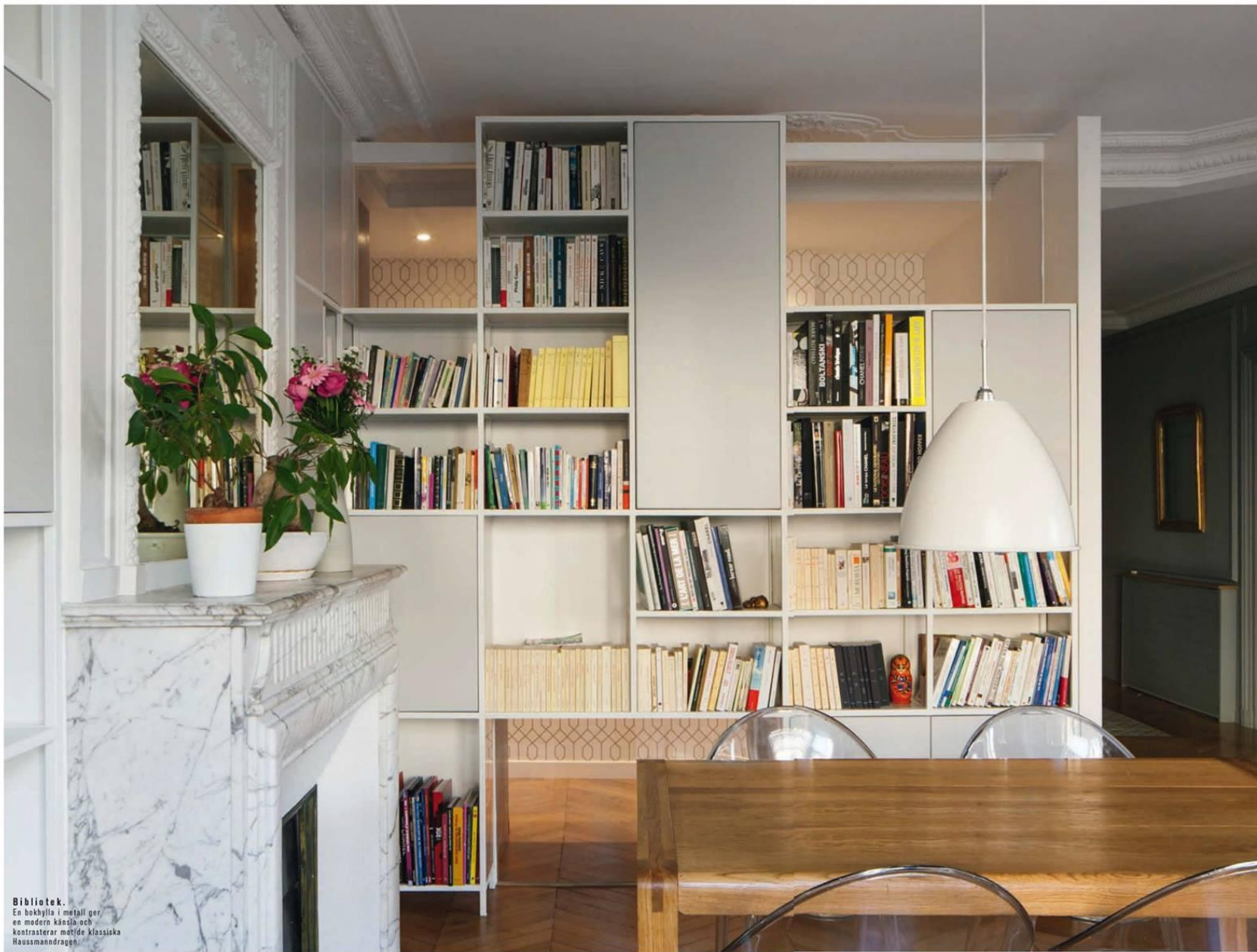
Bibliotek. En bokhylla i metall ger en modern känsla och kontrasterar mot de klassiska Haussmanndraget.