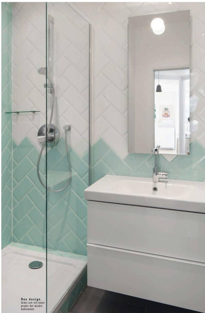
Ren design. Grönt och vitt kakel pryder det mindre badrummet.