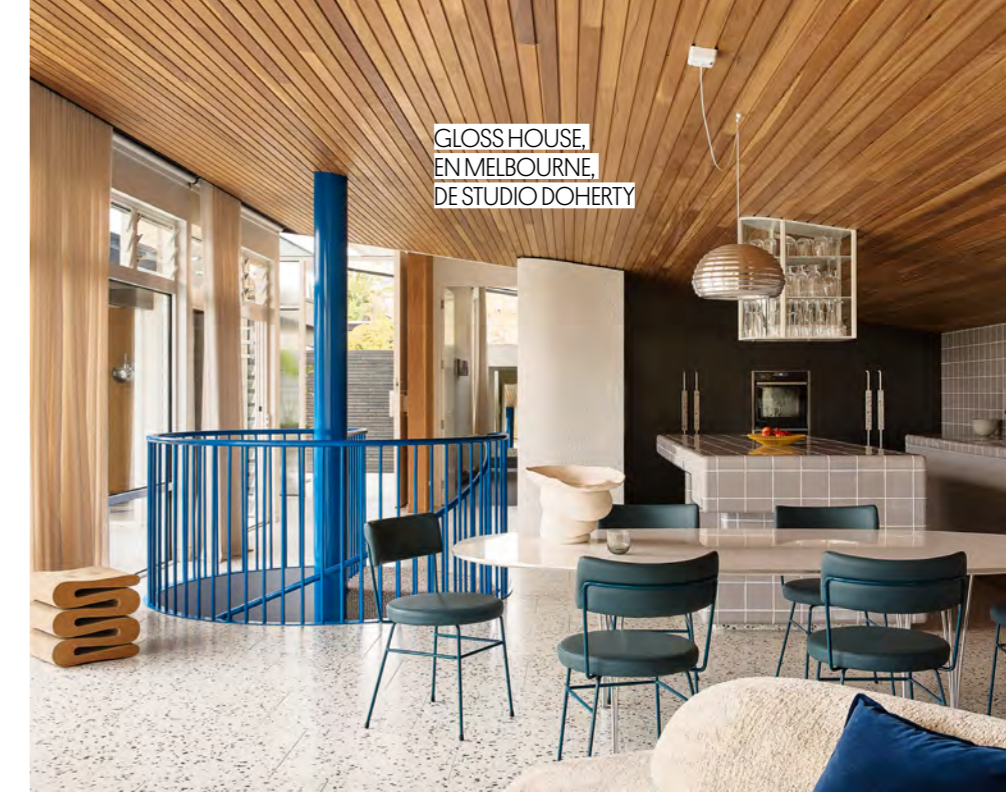
GLOSS HOUSE, EN MELBOURNE, DE STUDIO DOHERTY

soluciones de catálogo y poder innovar en cuanto a alturas y dimensiones, no necesariamente saliéndonos de lo estándar pero usando la modulación existente a nuestro favor y de forma innovadora", explican desde Febrero Studio. Junto a la nevera o el microondas –cada vez más mimetizados con el resto de elementos– ya no nos rechina ver textiles, obras de arte o una mezcla de materiales (como ocurre en la Gloss House de Studio Doherty, en Melbourne, Australia). "Los clientes quieren propuestas más allá de las arquetípicas", aseguran los integrantes de Claude Cartier Décoration. Y los interioristas, sin lugar a dudas, están más que dispuestos a dárselas.