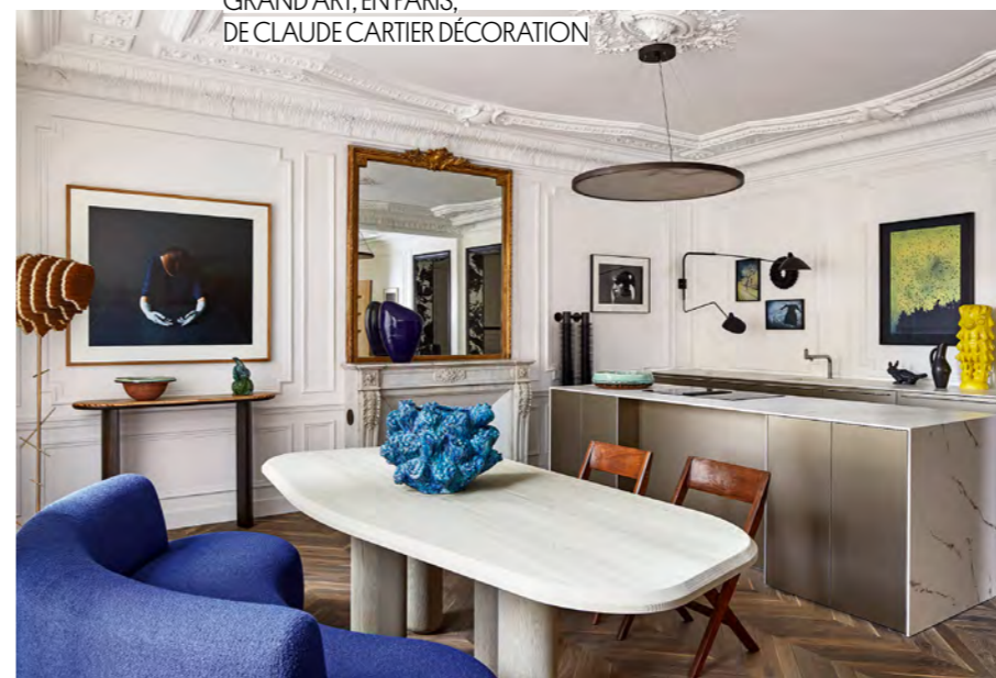
GRAND ART, EN PARÍS, DE CLAUDE CARTIER DÉCORATION

isladas del resto de la casa, e incluso condenadas al ostracismo, las cocinas fueron, durante décadas, lugares de paso o de trabajo. Sin embargo, el auge del interés por la gastronomía, así como la evolución de las dinámicas familiares, la aparición de nuevos hábitos sociales y la reducción de los metros cuadrados de nuestras viviendas han hecho que esta habitación haya ido adquiriendo mayor peso en los hogares. Tanto estéticamente como en importancia. Ahora las integramos en comedores y salones, utilizando de manera creativa materiales más lujosos y sostenibles, innovando en su estructura y ampliando la paleta de color y texturas sin prejuicios. Así lo creen los especialistas del estudio polaco Akura: "La cocina Frankfurt (1926), de Margarete Schutte-Lihotzky, marcó un antes y un después en cómo concebimos esta estancia. La diseñó pensando en el usuario y creó el espacio funcional definitivo: dejó de servir únicamente para preparar la comida y empezó a ser un lugar para socializar y pasar tiempo