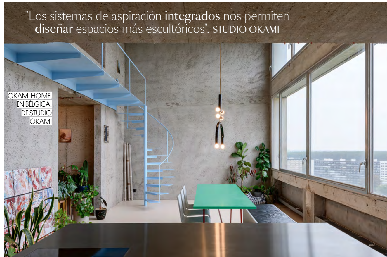
OKAMI HOME, EN BÉLGICA, DE STUDIO OKAMI

"Los sistemas de aspiración integrados nos permiten diseñar espacios más escultóricos ". STUDIO OKAMI