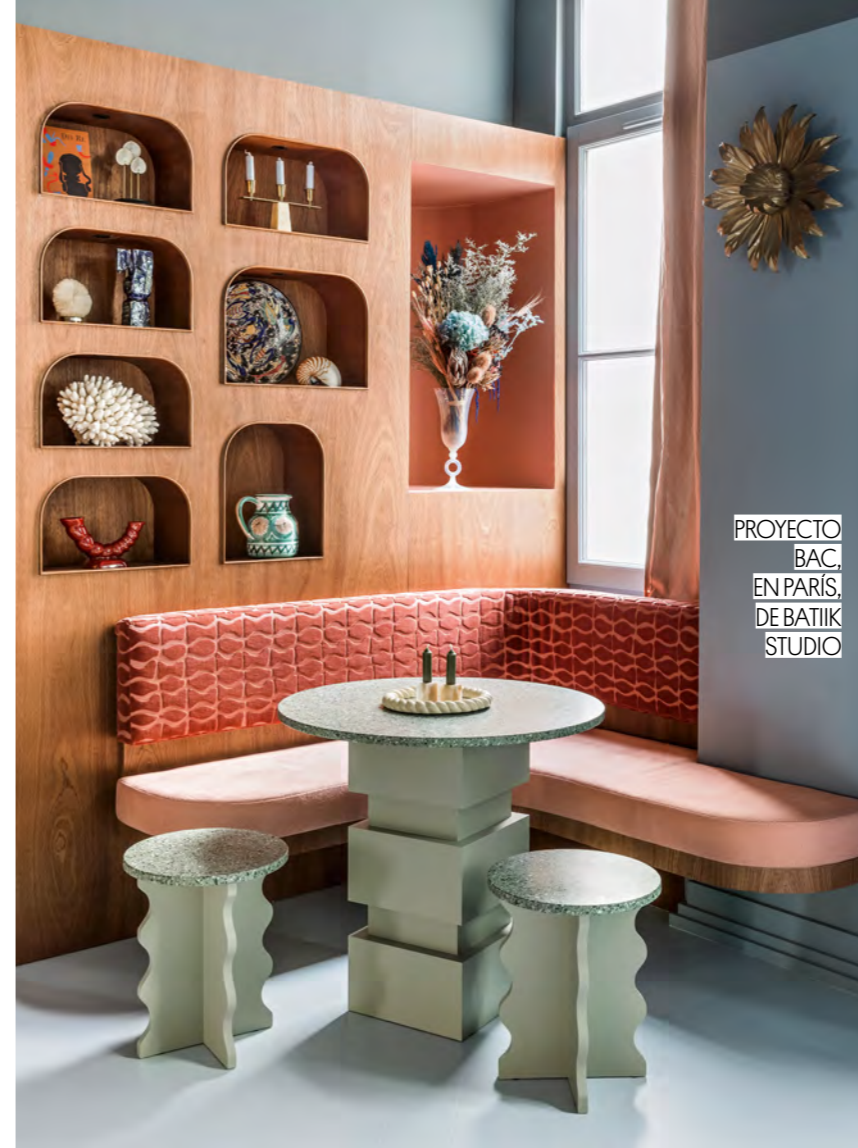
PROYECTO BAC, EN PARÍS, DE BATIOK STUDIO

"Es necesario que se diseñe como una zona de bienvenida: acogedora y abierta, pero con más espacio de almacenaje ". BATIOK STUDIO