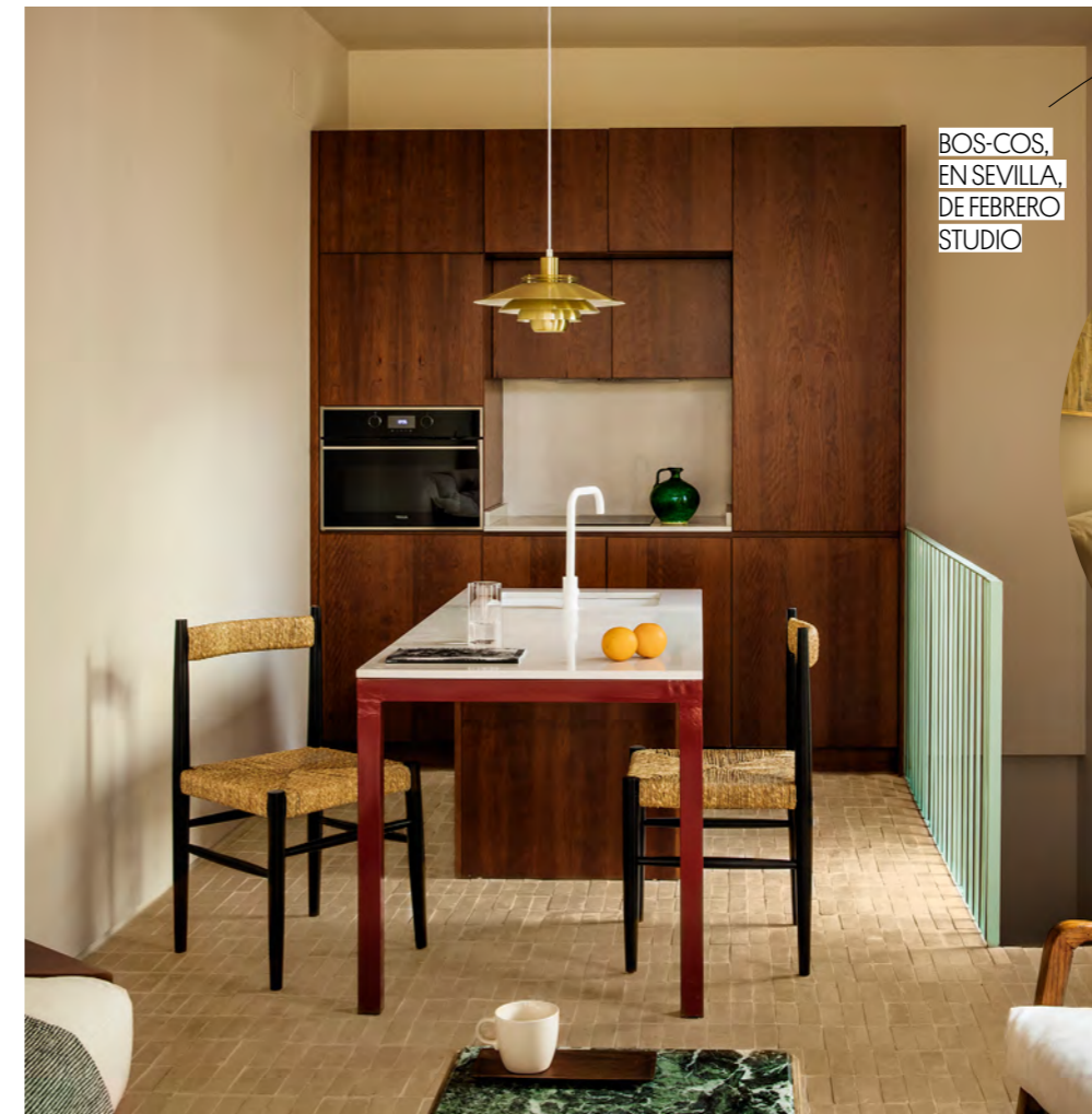
BOS-COS, EN SEVILLA, DE FEBRERO STUDIO