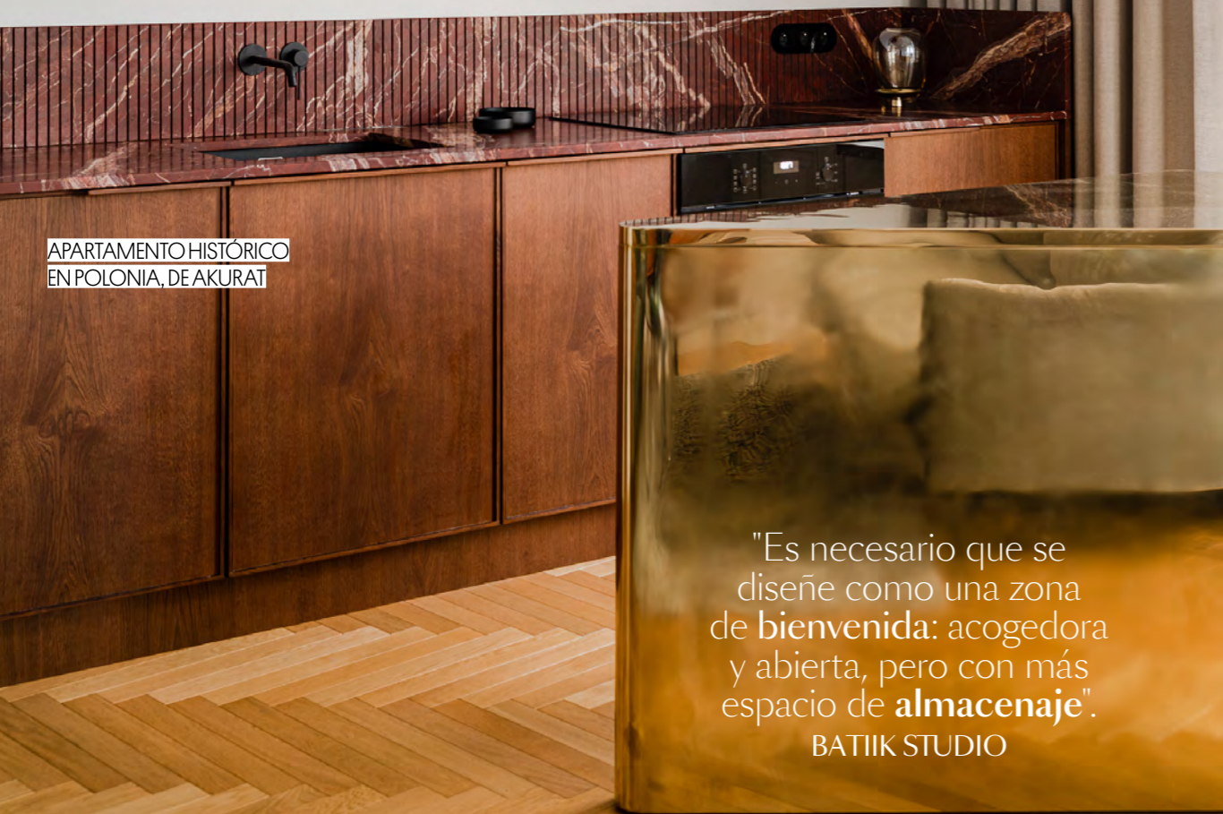
APARTAMENTO HISTÓRICO EN POLONIA, DE AKURAT

"Es necesario que se diseñe como una zona de bienvenida: acogedora y abierta, pero con más espacio de almacenaje ". BATIOK STUDIO